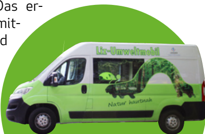
mit dem LIZ-Umweltmobil

Das Liz- Umweltmobil dient als Transportmittel für die vielfältigen Materialien, die für eine nachhaltige Naturerfahrung eingesetzt werden. Die BNE-Umweltbildungs-Programme finden draußen und in der Region der Schüler:innen statt. Das ermöglicht ihnen ein unmittelbares Erleben und eine Naturerfahrung vor Ort und kann so einen ganz neuen Zugang und eine Identifikation mit der eigenen Region schaffen.