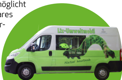
mit dem LIZ-Umweltmobil

Das Liz-Umweltmobil dient als Transportmittel für die vielfältigen Materialien, die für eine nachhaltige Naturerfahrung eingesetzt werden. BNE-Umweltbildungsprogramme finden draußen und in der Region der Schüler:innen statt. Das ermöglicht ihnen ein unmittelbares Erleben und eine Naturerfahrung vor Ort und kann so einen ganz neuen Zugang und eine Identifikation mit der eigenen Region schaffen.